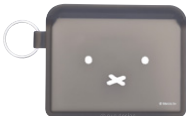
フェイスブラック